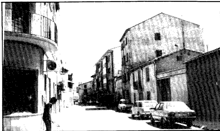
Panorámica de Binéfar

Ha sido el Servicio de Extensión Agraria, dependiente de la Diputación General de Aragón, el que ha